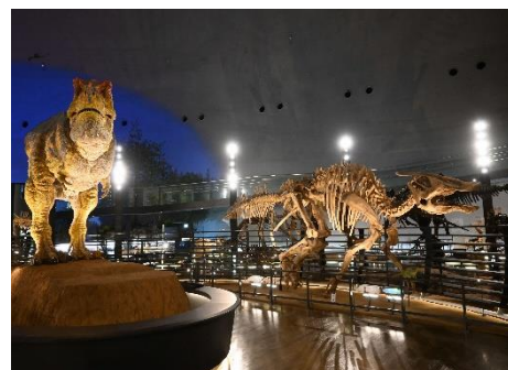
福井県立恐竜博物館